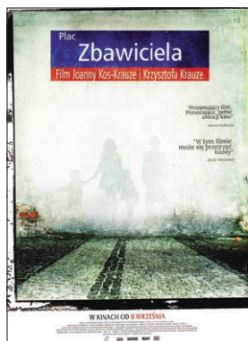
Plac Zbawiciela (Joanna Kos-Krauze, Krzysztof Krauze, 2006)

Historia współczesna i niestety aktualna. Główni bohaterowie filmu to młode małżeństwo z dwójką dzieci. Małżeństwo zamierza się wyprowadzić do nowego mieszkania. Bohaterowie wyobrażają sobie jak urządzią nowe mieszkanie, jaka ma być aranżacja, jakie ogrzewanie. W pewnym momencie do małżeństwa dociera niepokojąca wiadomość – deweloper budujący wymarzone mieszkanie zbankrutował. To wydarzenie było początkiem problemów. Młode małżeństwo musiało zamieszkać u matki w ciasnym mieszkaniu przy warszawskim Placu Zbawiciela. Zaczęły pojawiać się konflikty z teściową. Beata, która nie może porozumieć się z teściową ma trudności z przystosowaniem się do nowej sytuacji. Beata robi zakupy, na które wydaje ostatnie pieniądze, nie