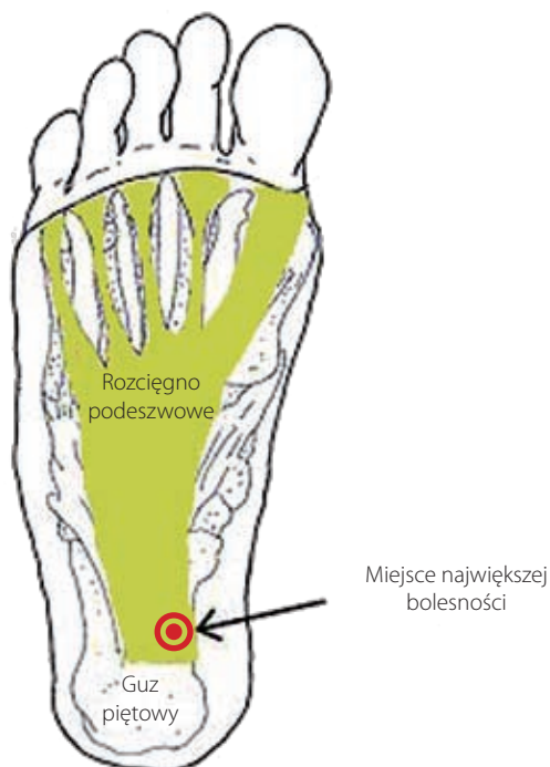
Ryc. 1. Przebieg rozciągna podeszwowego z zaznaczonym miejscem największej bolesności podczas zapalenia.

Koślawość pięty jest wynikiem minimalnych zaburzeń pracy mięśni podtrzymujących łuk podłużny stopy i pięty w po-